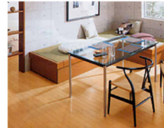
① 複合フローリング 12mm厚