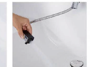
ホースを引き出して、ボウル手前に水を流すこともできます。