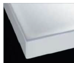
H グレーン材ホワイト