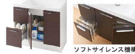
ソフトサイレンス機構