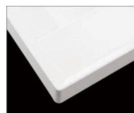
□ H プレーン材ホワイト