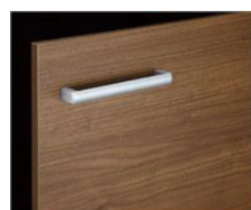
□ LM2 クイエモカ