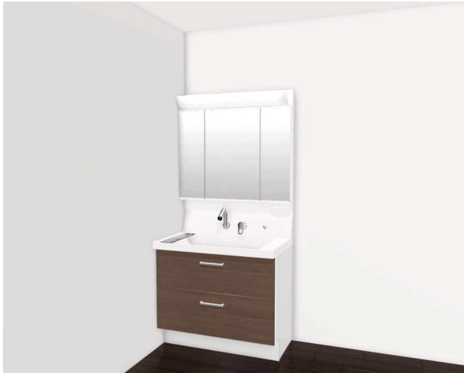
CG合成によるイメージ画像です。