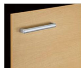
□ LP2 クイエール