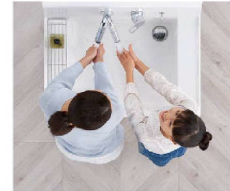
2人並んでの身支度もスムーズ