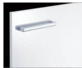
□ YS2 クイエホワイト