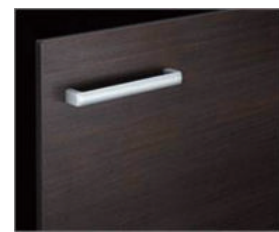
□ LD2 クイエターク