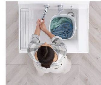
つけ置き洗い中も、バケツを避けての手洗いもOK