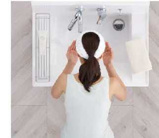
洗顔・洗髪もゆったりスペースで