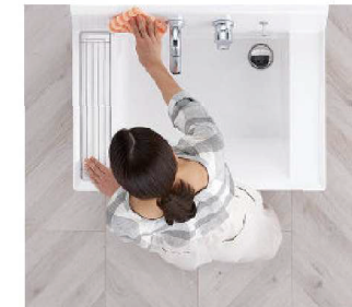
汚れにくくお掃除もカンタン